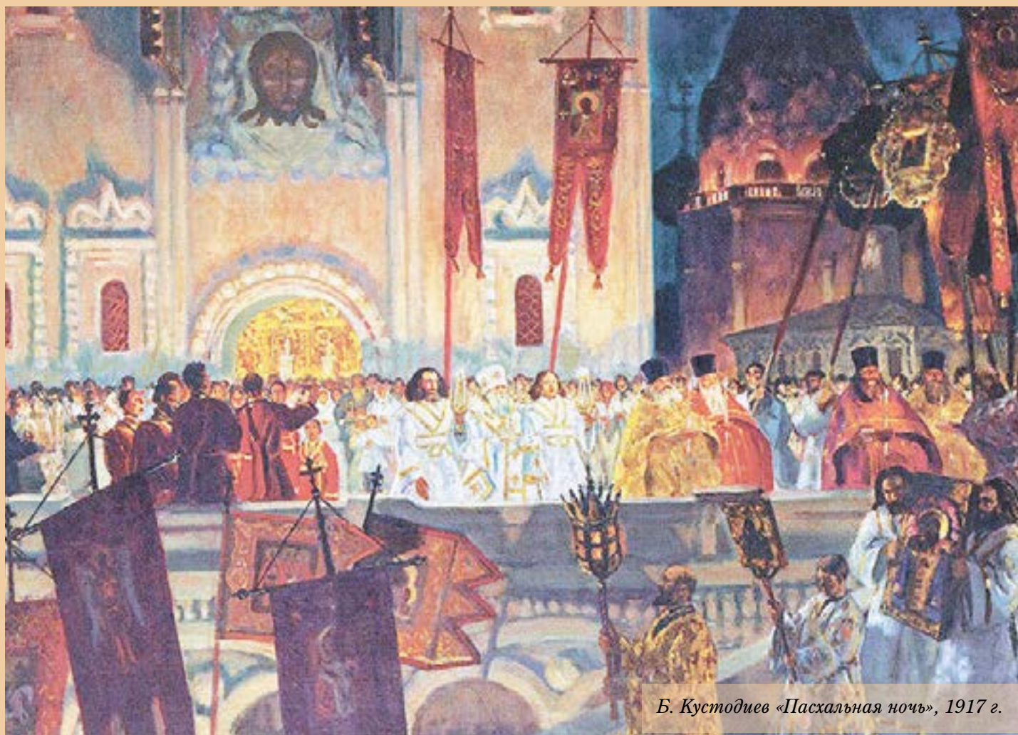
Б. Кустодиев «Пасхальная ночь», 1917 г.