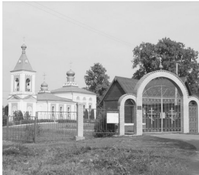
Храм с. Буриново (современное фото)