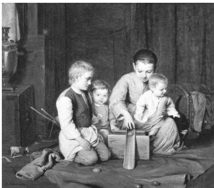
«Дети, катающие пасхальные яйца», Николай Кошелев (1855 г.)

Перечень композиторов, воспевающих Воскресение Христа, можно продолжать. Сейчас все их произведения в разном исполнении можно найти во всемирной сети Интернет. Надеемся, что в каждом доме православных христиан зазвучит музыка, воспевающая Хри-