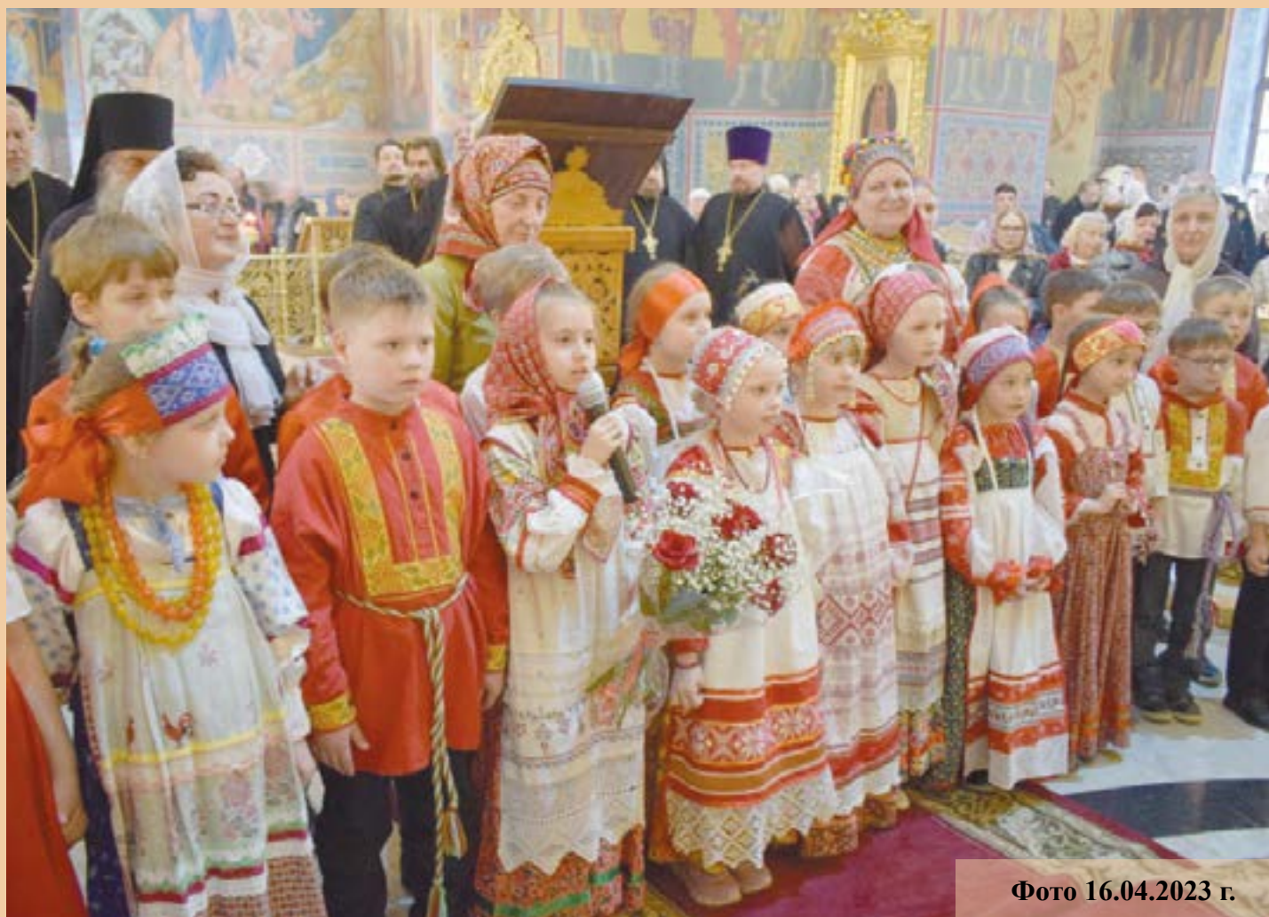
Фото 16.04.2023 г.