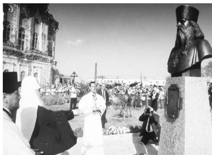
Патриарх Кирилл освящает памятник отцу Антонину на его родине, в селе Батурино, 2017 год. 200-летие со дня рождения отца Антонина.

Да зажжется святая русская звезда на небе святого града Иерусалима!