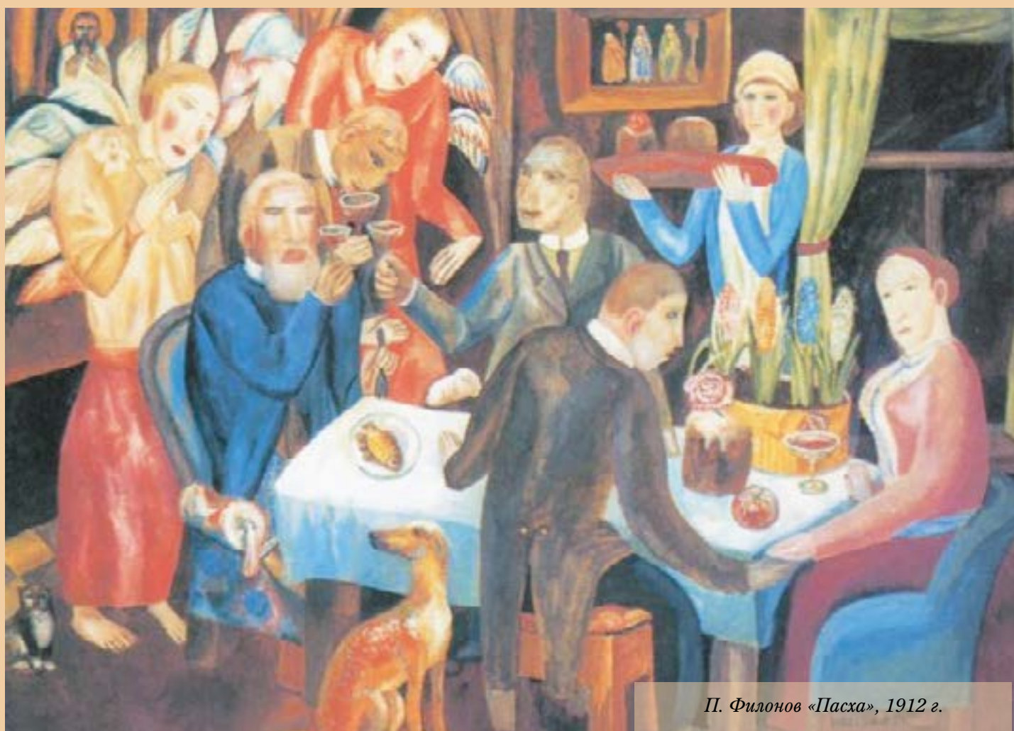
П. Филонов «Пасха», 1912 г.