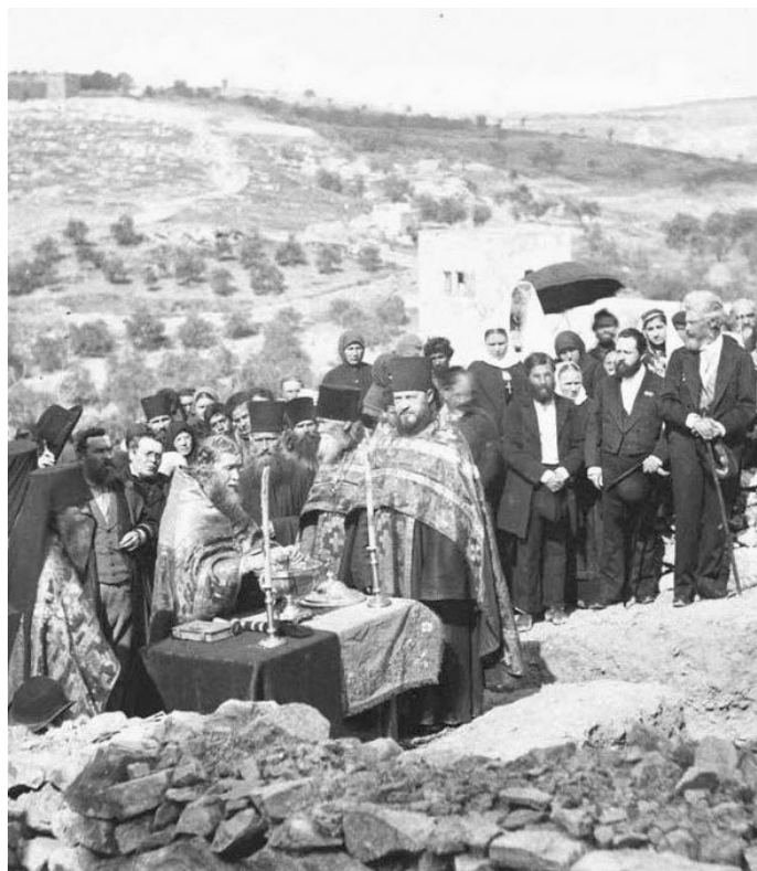
Служение отца Антонина в полевых условиях Святой Земли.

делением Императорского православного палестинского общества».