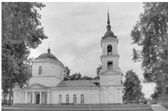
Храм с. Истомино (современное фото)

Речь в статье пойдет о жизни и подвиге священномученика, канонизированного в 2000 году, Иоанна Флоровского или же Фроловского. В публикациях и даже документах часто встречаются разночтения при написании фамилии отца Иоанна. Это связано с неудобством произношения исконного варианта Флор от латинского Флорианус. Что привело к упрощенной разговорной форме Фрол, что более удобно для произношения нежели Флор. Такие замены встречались и в названиях сел, образованных от имени Флор. Так, одно и то же село Флоровское в разные периоды в официальных документах называли и Фроловским. В 1799-1800 гг., например, по данным одного из дел Государственного архива Ярославской области, числится под следующим названием: «Дело об определении семинариста Иконникова в священники к церкви с. Флоровского Мышкинского уезда...» В Ярославских губернских ведомостях № 13 за 1832 год приводится иначе: «В Мышкинский Уездный Суд вызываются ... Мышкинской округи села Фроловскаго священники Иоанн Соболев...» В книге «Именная роспись начальствующих и служебных лиц Ярославской епархии» 1861 года именуется Флоровским: «О причте Церкви села Флоровского, 1861 год».