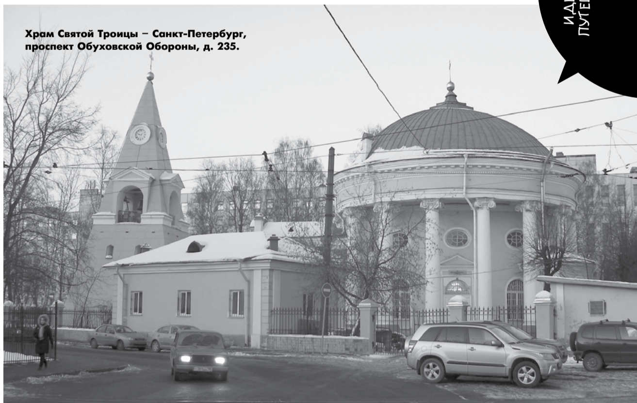
Храм Святой Троицы – Санкт-Петербург, проспект Обуховской Обороны, д. 235.