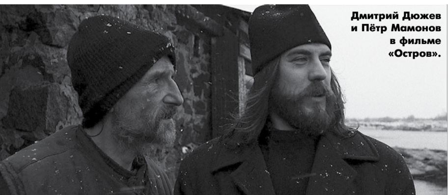
Дмитрий Дюжев и Пётр Мамонов в фильме «Остров».