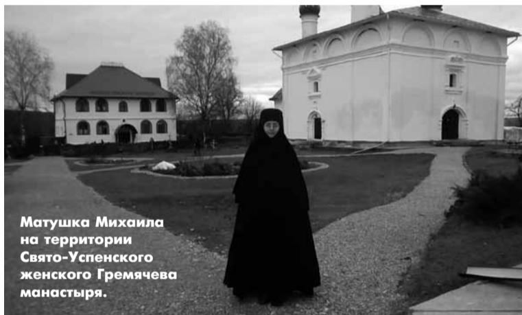
Матушка Михаила на территории Свято-Успенского женского Гремячева монастыря.

Матушка: Ноев Ковчег обычно с Церковью сравнивают. Когда греховный мир погибал, и его нельзя было спасти, потому что