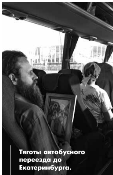
Тяготы автобусного переезда до Екатеринбурга.

Е ЩЕ ОДНА НОЧЬ И ПОЛДНЯ — И мы в Екатеринбурге. Высаживаемся у Храма-на-Крови. До конца 1970-х годов на этом месте