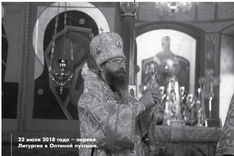
22 июля 2018 года – первая Литургия в Оптиной пустыни.

Беседовал Максим ВАСЮНОВ.