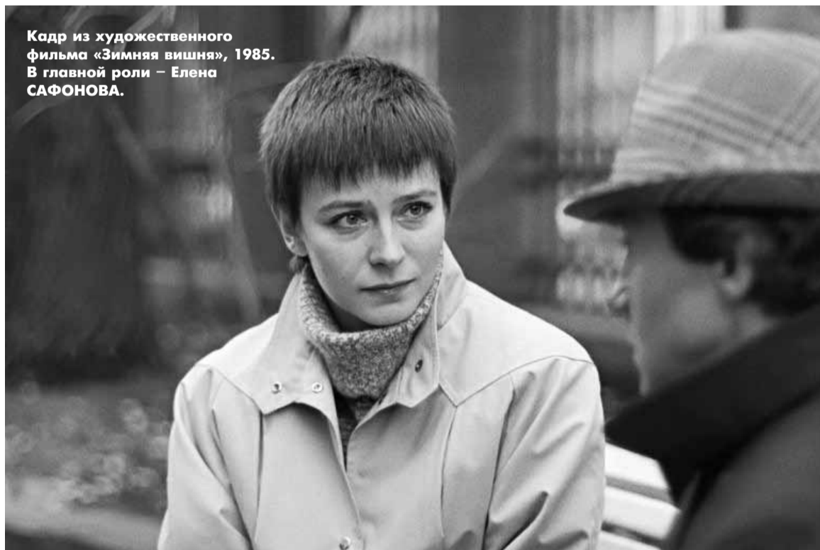
Кадр из художественного фильма «Зимняя вишня», 1985. В главной роли — Елена САФОНОВА.