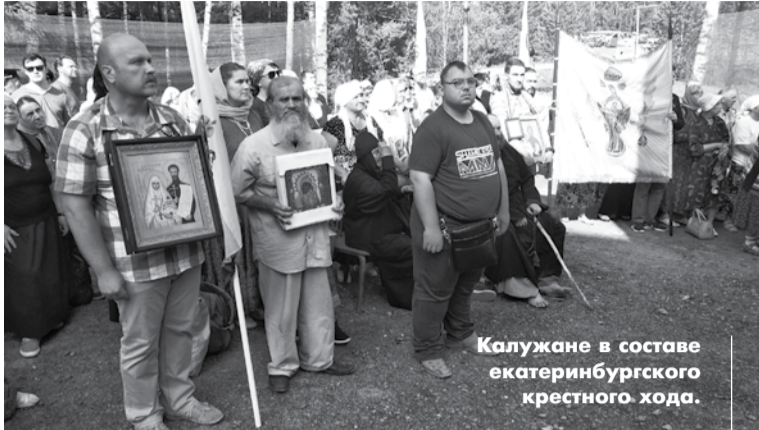
Калужане в составе екатеринбургского крестного хода.

один на один с собой и с Богом. Чтобы пройти двадцать один километр, потребовалось около четырех часов. Все это время звучала молитва Иисусова. Оказывается, есть специальный маршевый распев для этой короткой молитвы. Он позволяет держать быстрый темп, не расслабляться и не распускать мысли.