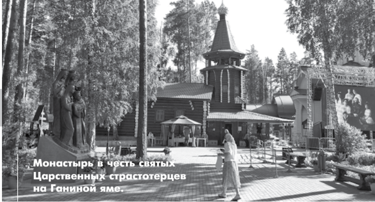
Монастырь в честь святых Царственных страстотерпцев на Ганиной яме.

ПАНИНА ЯМА Про то, что устали, хотим спать и есть, почему-то забылось. Нужно сегодня успеть в монастырь в честь святых Царственных страстотерпцев на Ганиной яме. Завтра, когда мы придем туда со стотысячным Крестным ходом, возможности что-либо