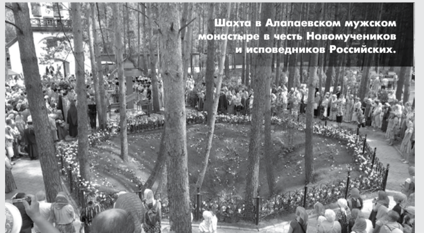
Шахта в Алапаевском мужском монастыре в честь Новомучеников и исповедников Российских.

увидеть, тем более рассмотреть, не будет.