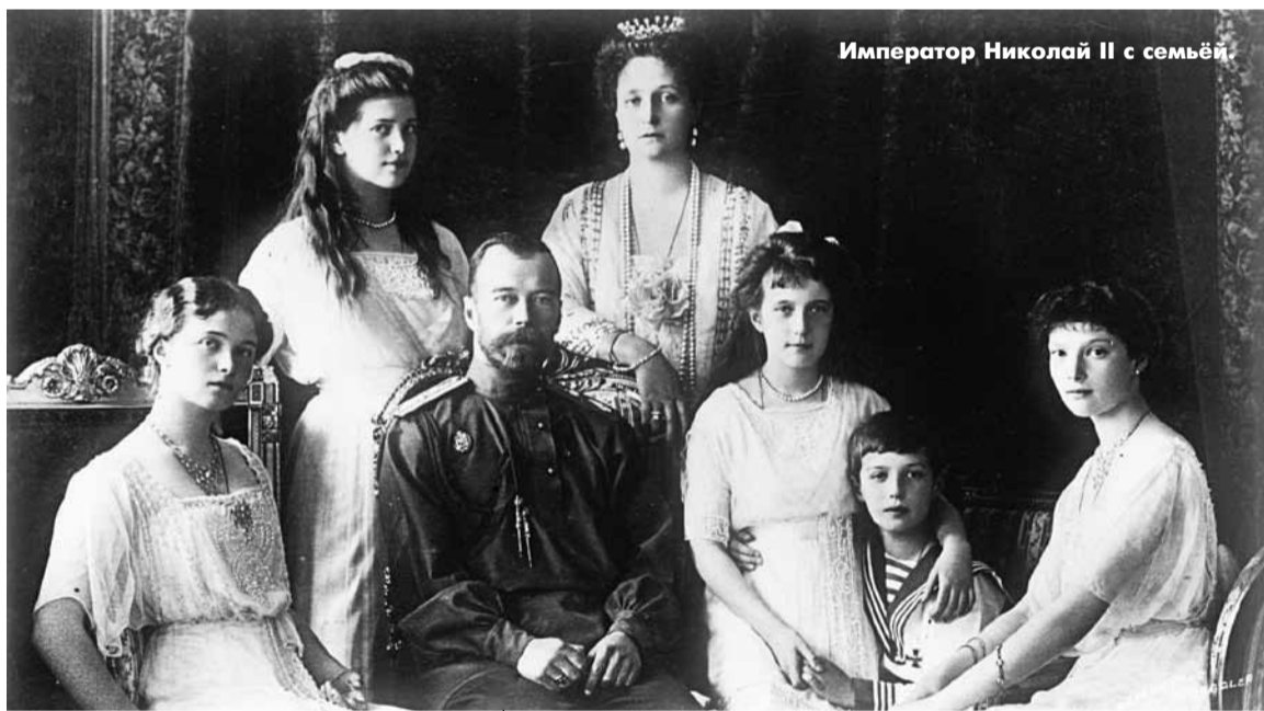
Император Николай II с семьёй.

лебать трон Николая и его династии», как делал это Лев Толстой (по крайней мере, так о великом графе отзывался друг и издатель Чехова Суворин). Антон Павлович вообще старался в политические игры не вникать, не зарабатывать на этом дивидендов и даже публично о политике не говорить. В этом смысле абсолютно непонятно стремление либералов называть Чехова своим, так же, как и желание коммунистов поставить великого драматурга в свои ряды и повесить на него красный галстук. Известны лишь две гражданские (неполитиче-