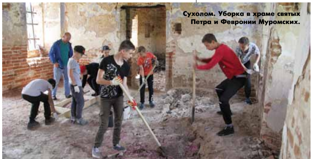
Сухолом. Уборка в храме святых Петра и Февронии Муромских.