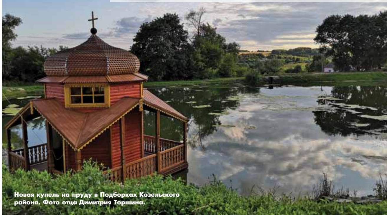
Новая купель на пруду в Подборках Козельского района.