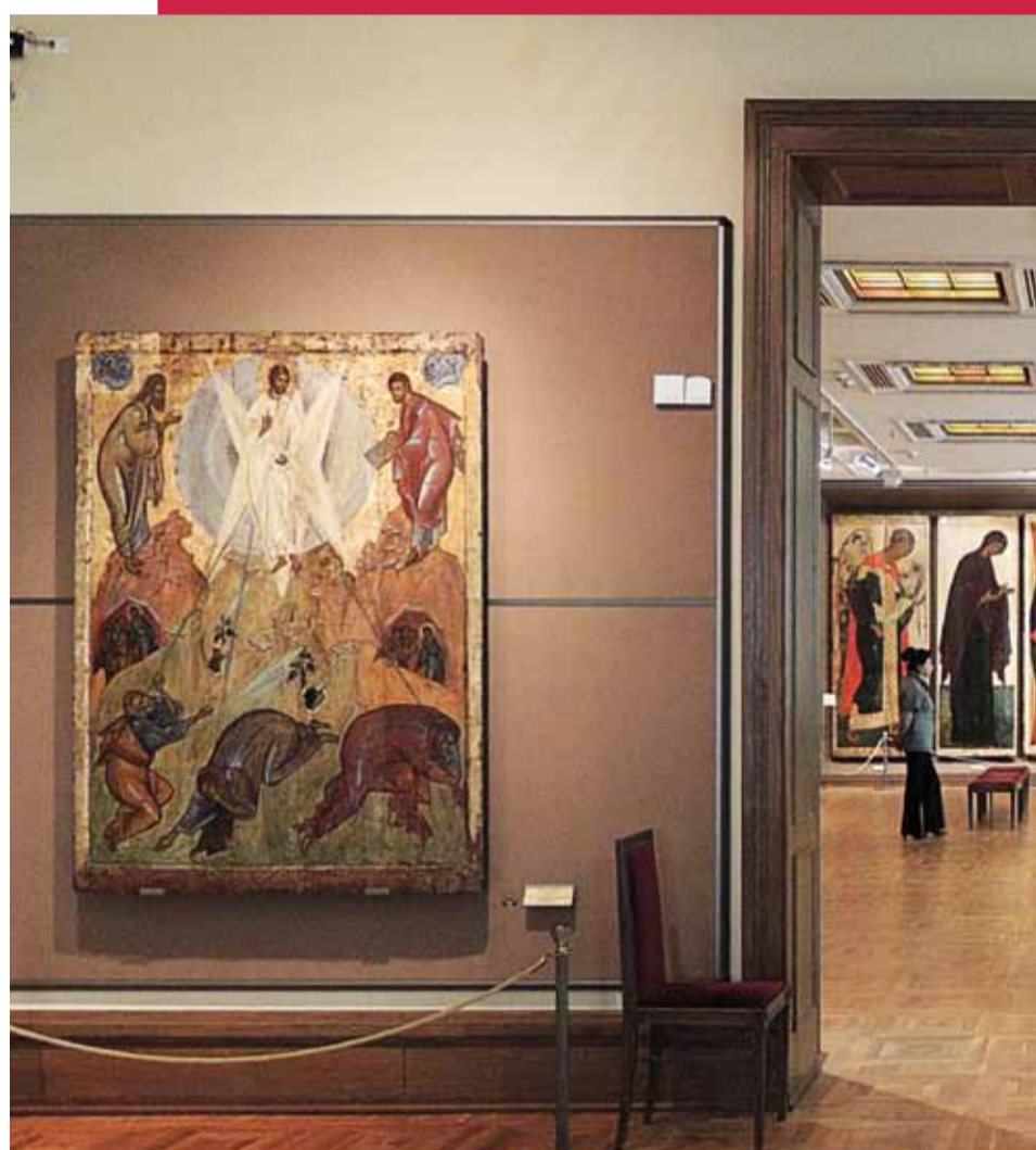
Феофан Грек. Преображение. Икона начала XV века. Зал Древнерусского искусства Государственной Третьяковской галереи.