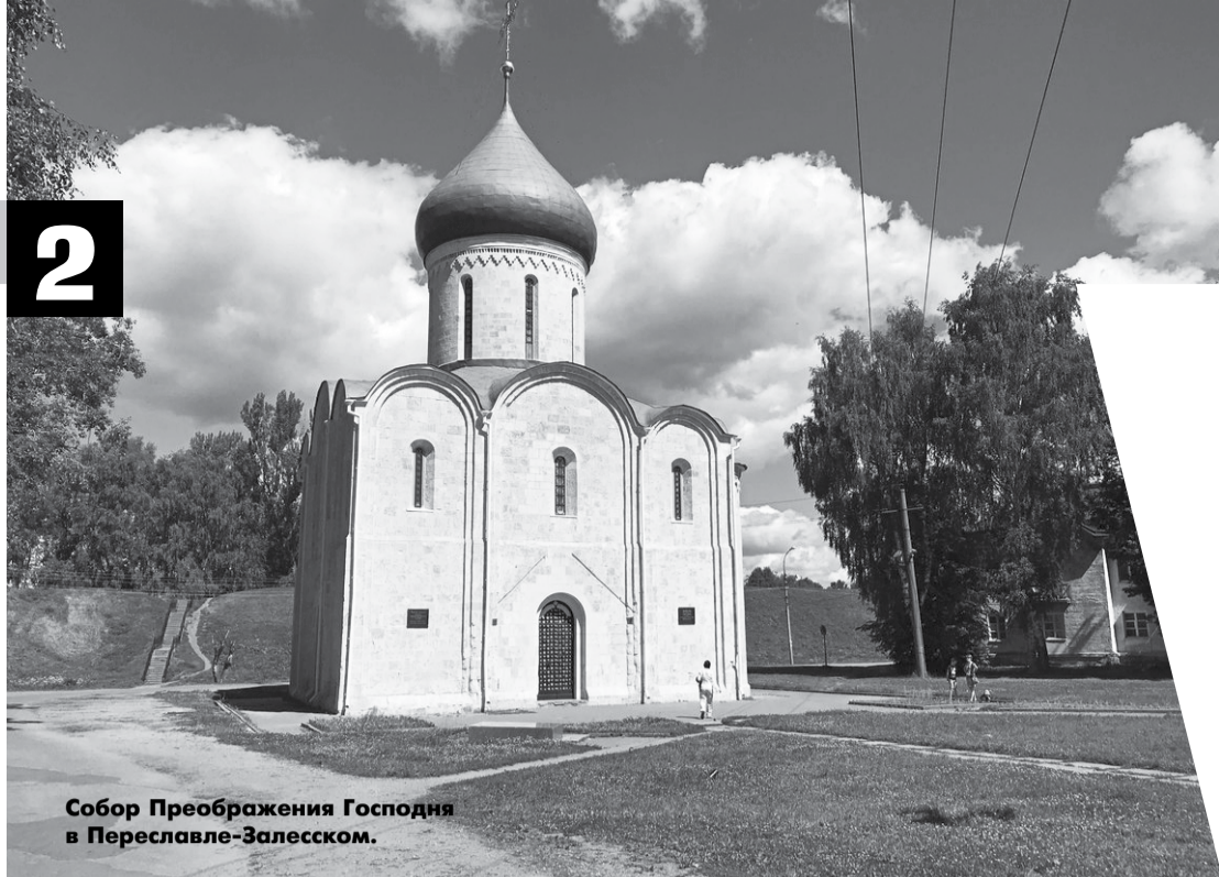
Собор Преображения Господня в Переславле-Залесском.

П раздники Троицы и Преображения в сознании многих православных идут вместе. Во-первых, и тот и другой приходятся практически всегда на лето, во-вторых, эти праздники отмечаются ярко, вокруг них много красивых традиций: украшение берёзовыми ветвями на Троицу, освящение яблок на Преображение... Наконец, наше народное подсознание помнит, что если с Троицей связано зарождение государства, главная победа русских – над игом и над собой, то Преображение напоминает, что вера и любовь способны преобразить и сожжённые города, и вытопанные поля, и униженные души.