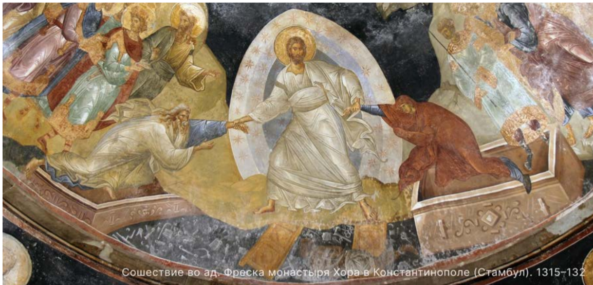
Сошествие во ад. Фреска монастыря Хора в Константинополе (Стамбул). 1315–132