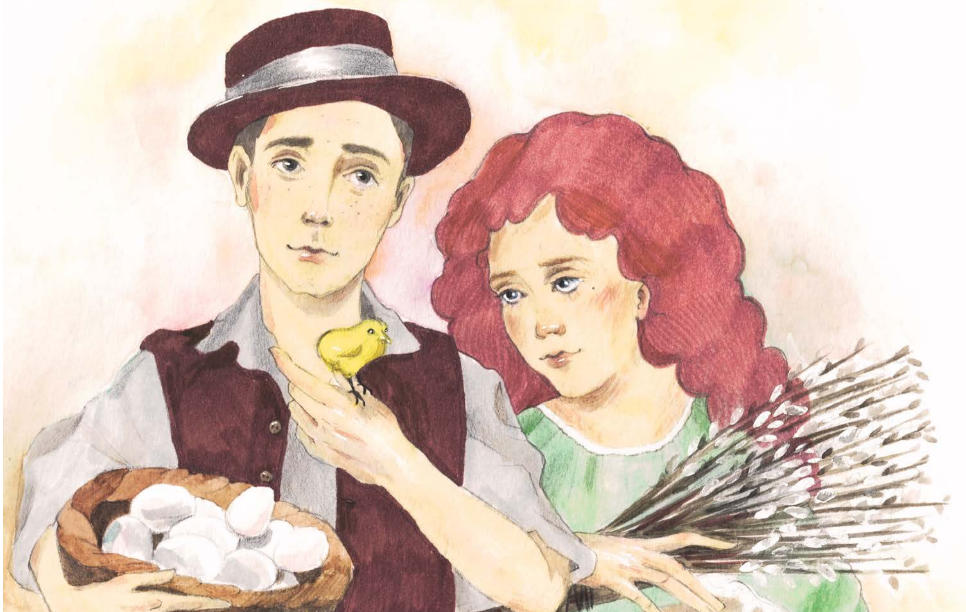
Иллюстрация: Анастасия СИБИЛЬ

Издается по благословию митрополита Калужского и Боровского Климента. Одобрено Синодальным информационным отделом Русской Православной Церкви.