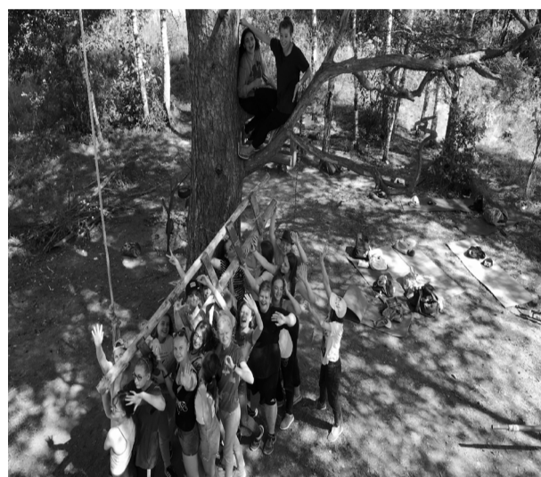
в прекрасном и светлом православном детском лагере «Златоуст».