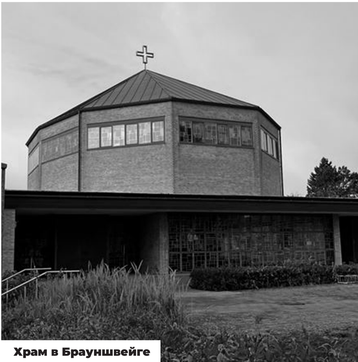
Храм в Брауншвейге

Что касается прихожан - это и русские немцы, и россияне, и украинцы, и сербы. Также у нас в храме относительно много принявших Православие немцев, которые в последнее время все больше интересуются нашей