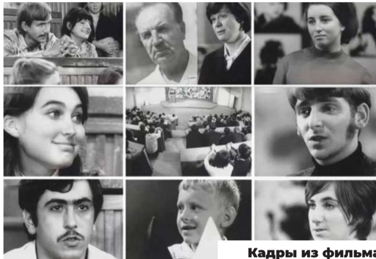
Кадры из фильма

людей, и спросишь себя: «Взять ли силой али смиренною любовью?» Всегда решай: «Возьму смиренною любовью». Решишься так раз навсегда и весь мир покорить сможешь. Смирение любовное — страшная сила, изо всех сильнейшая, подобной которой и нет ничего. На всяк день и час, на всякую минуту ходи около себя и смотри за собой, чтоб образ твой был благолепен. Вот ты прошел мимо малого ребенка, прошел злобный, со скверным словом, с гневливой душой; ты и не приметил, может, ребенка-то, а он видел тебя, и образ твой, неприглядный и нечестивый, может, в его беззащитном сердечке остался. Ты и не знал сего, а может быть, ты уже тем в него семя бросил дурное, и возрастет оно,