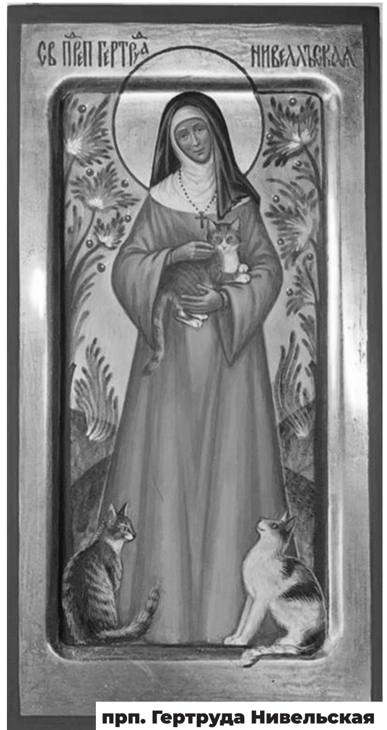
прп. Гертруда Нивельская

Ведь глядя на нас, они понимают, что, в отличие от местных католиков и протестантов, мы очень серьезно относимся к Библии, регулярно молимся, держим посты и стараемся не идти на поводу у современности, придерживаемся патриархальных традиций и в семье, и в общественной жизни.