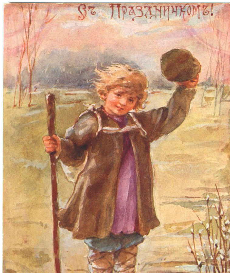
В.А. Никифоров-Волгин «Светлая заутреня»