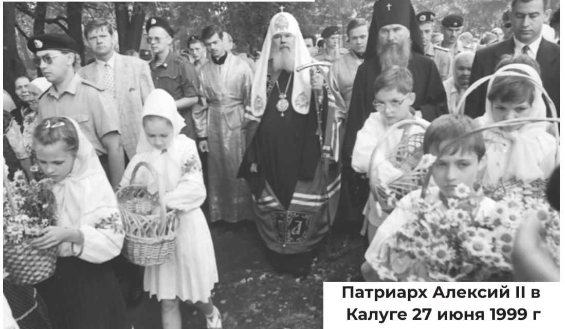
Патриарх Алексий II в Калуге 27 июня 1999 г

В нынешнем 2024 году мы отмечаем 25-летний юбилей этой знаменательной даты в истории Калужской епархии.